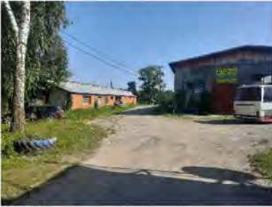
Вигляд з 1.А