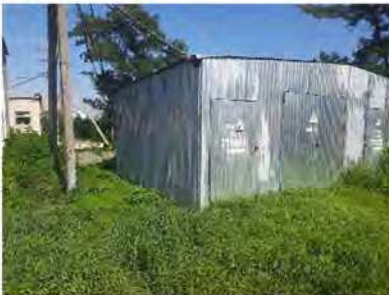
Вигляд з 1.В