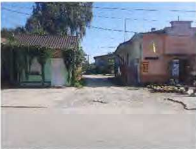
Вигляд з 1.Б