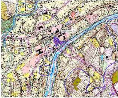
Місце розташування земельної ділянки в структурі населеного пункту смт.Печеніжин

Детальний план території по вул.Незалежності 6в/1 в смт.Печеніжин Коломийського району Івано-Франківської області для реконструкції будівель під магазин оптово-роздрібною торгівлі непродовольчих товарів з підсобними та допоміжними приміщеннями (в районі користування земельної ділянки ТОВ "Вігор") Проектний план та схема проектних обмежень у використанні земель М 1:500