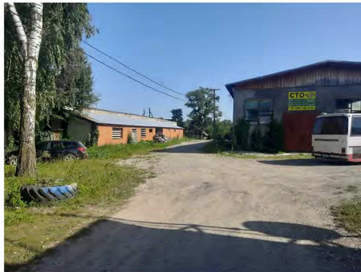
Вигляд з т.А