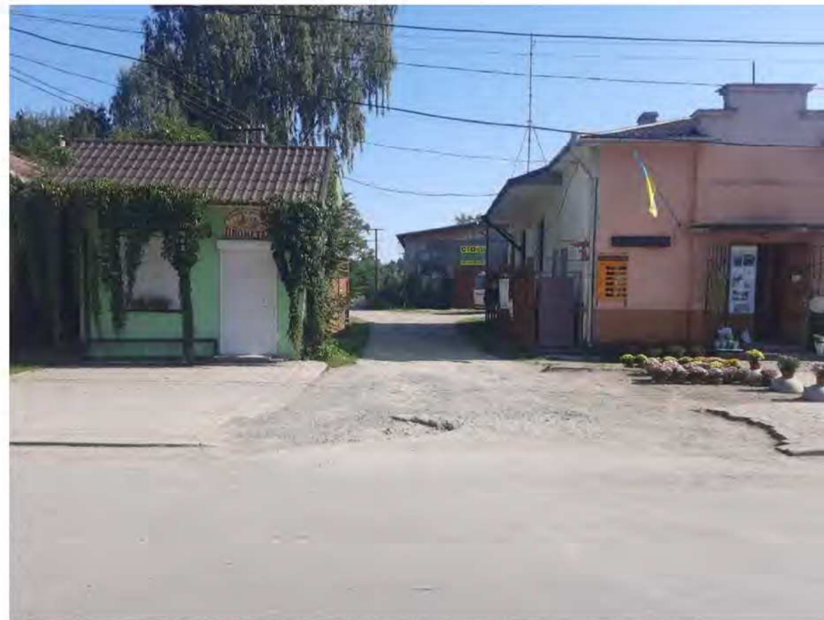
Вигляд з т.Б