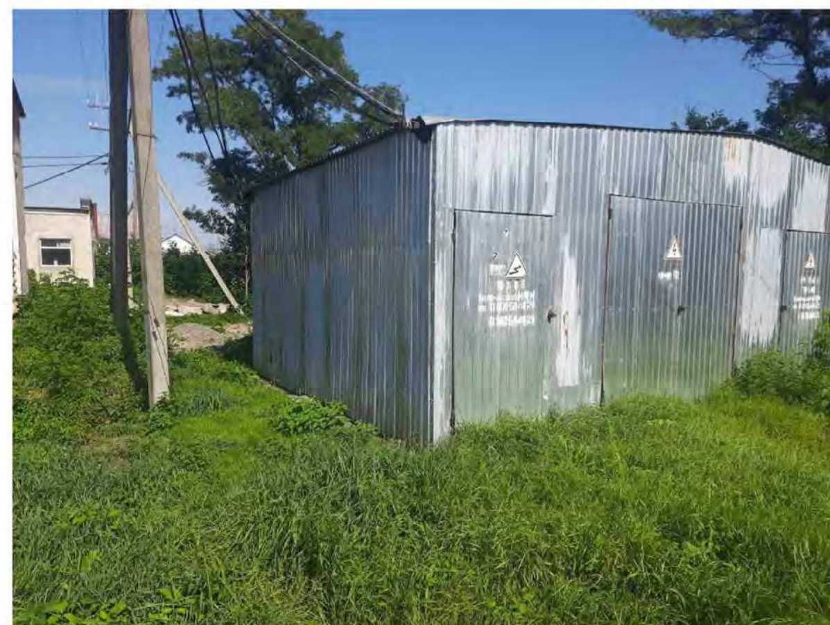
Вигляд з т.В